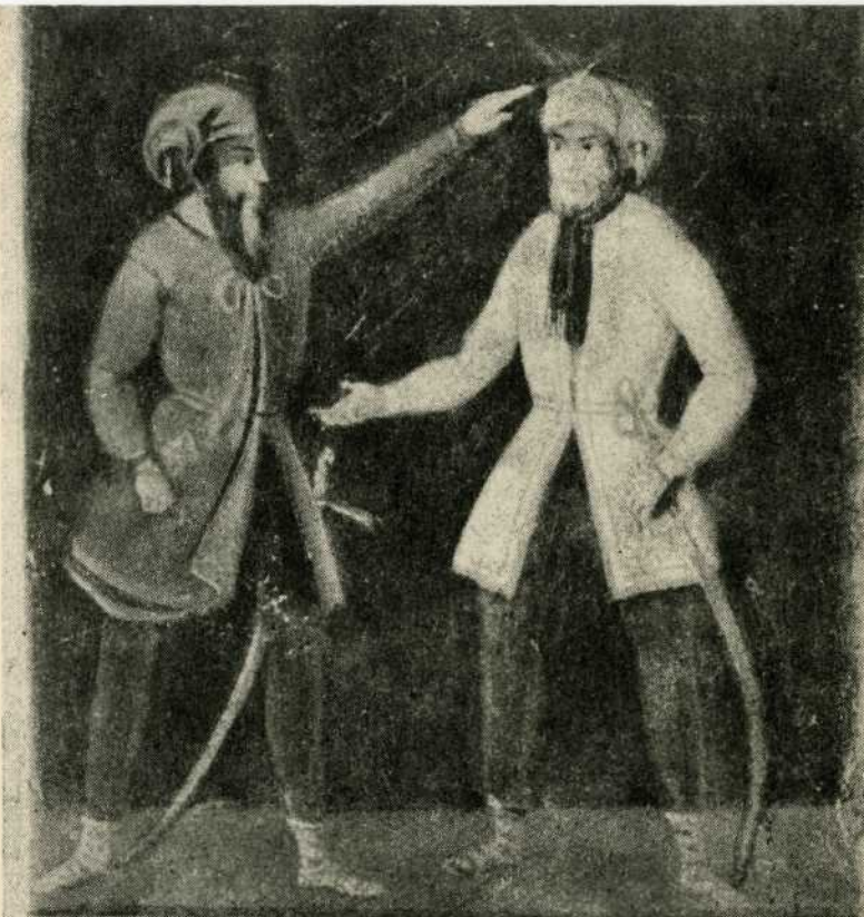
BURMUTICA (oko 1840. godine) s likovima Iliraca i stihovima: »Bog daj sreću svakom Sinu Koj ljubi Domovinu Bože Živi sve Ilire Da se slože i razšire.«