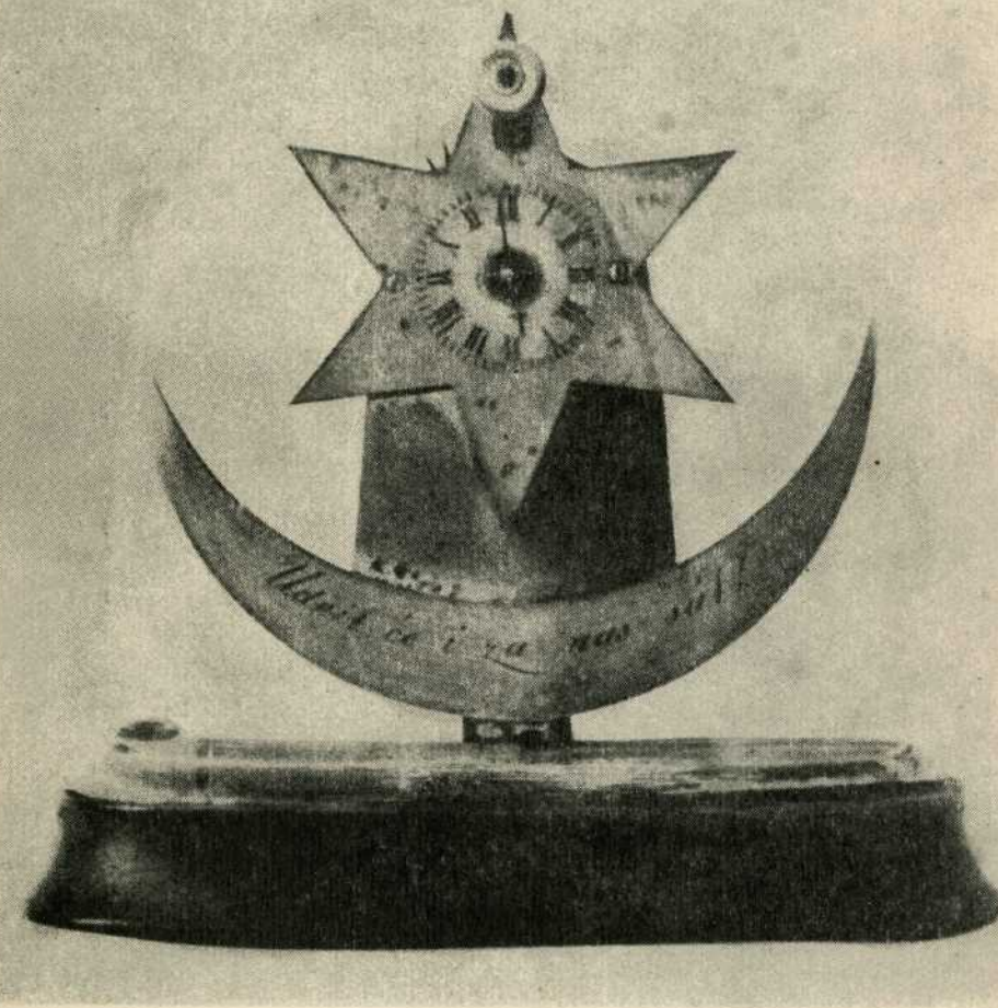
SAT U OBLIKU ILIRSKOG GRBA. Na polumjesecu: »Udrit će i za nas sat!«. Iz posjeda Ljudevita Gaja (oko 1840. godine)