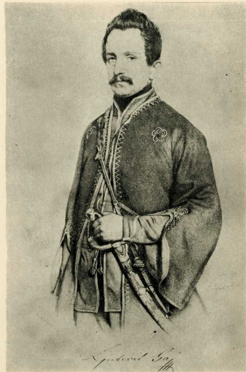
FRANZ EYBL (1806—1880): LJUDEVIT GAJ, litografija 1848. godine

Od 1830. godine pojavljuje se niz malih ali djelotvornih napisa koji iznose osnovne postavke pokreta. Prema programu nastoji se ukloniti svaki tuđinski utjecaj iz kulture i dnevnog života. Upotreba narodnog jezika, prevođenje vlastitih imena na hrvatski, prihvaćanje odjeće seljačkog kroja, budnice i davorije, uvođenje kola umjesto stranih društvenih plesova bili su samo vanjski oblici manifestiranja narodne pripadnosti. Najizrazitiji i najistaknutiji znak bio je grb: polumjesec i zvijezda, za koji se smatralo da potječe još od starih Ilira, a njime su se ukrašavali najrazličitiji predmeti dnevne upotrebe: od koplja zastave i zaglavlja novina do muške crvenkape i ženske ručne torbice.