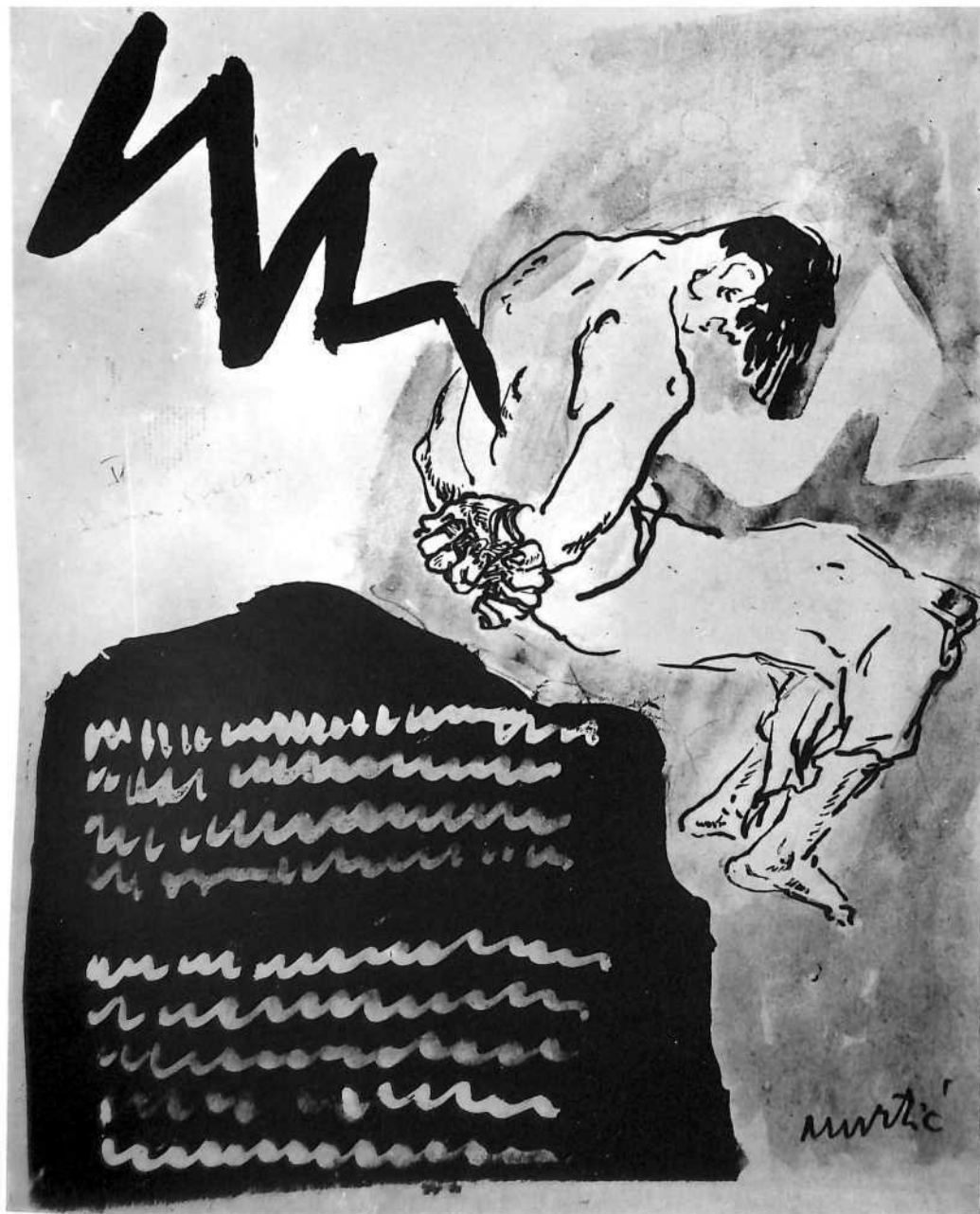
Studija za ilustraciju "Jame", 1944.