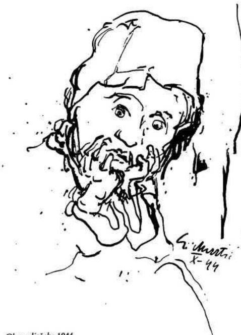
Glava dječaka 1944.

svoj danak efemernom uživajući (umjetničku) slobodu i onda kad je za druge nije bilo u izobilju. Murtić se za svoj izdvojeni jezik ne bori iz civilizacijskih principa, nego iz unutrašnje, intimne potrebe. On ne misli na druge, ali radi i za njih. O njegovoj ambivalentnosti – i ustrajnosti u njoj – govori i podatak da je on jedini partizanski umjetnik u Hrvatskoj (a možda i u cijeloj Jugoslaviji), koji će u pedesetim godinama stoljeća – s »Doživljajem Amerike« 1952. i informalnim slikama oko 1959 – biti protagonist oslobađanja, uvođenja svjetskih »žargona«, protagonist (lingvostilističke) avangarde. Bilo ih je još koji su slikali moderno, s neprijepornom personalnošću (kao Prica ili Reiser), no samo je Murtić pristao da se izloži rizicima »otvorena djela«, neizvjesnosti aleatoričke kaligrafije.