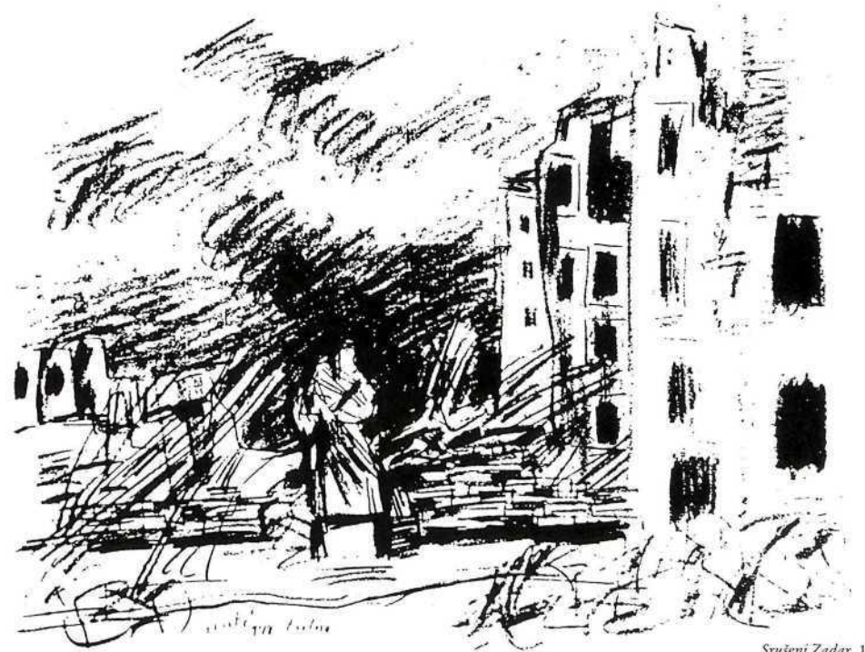
Srešeni Zadar, 1944.