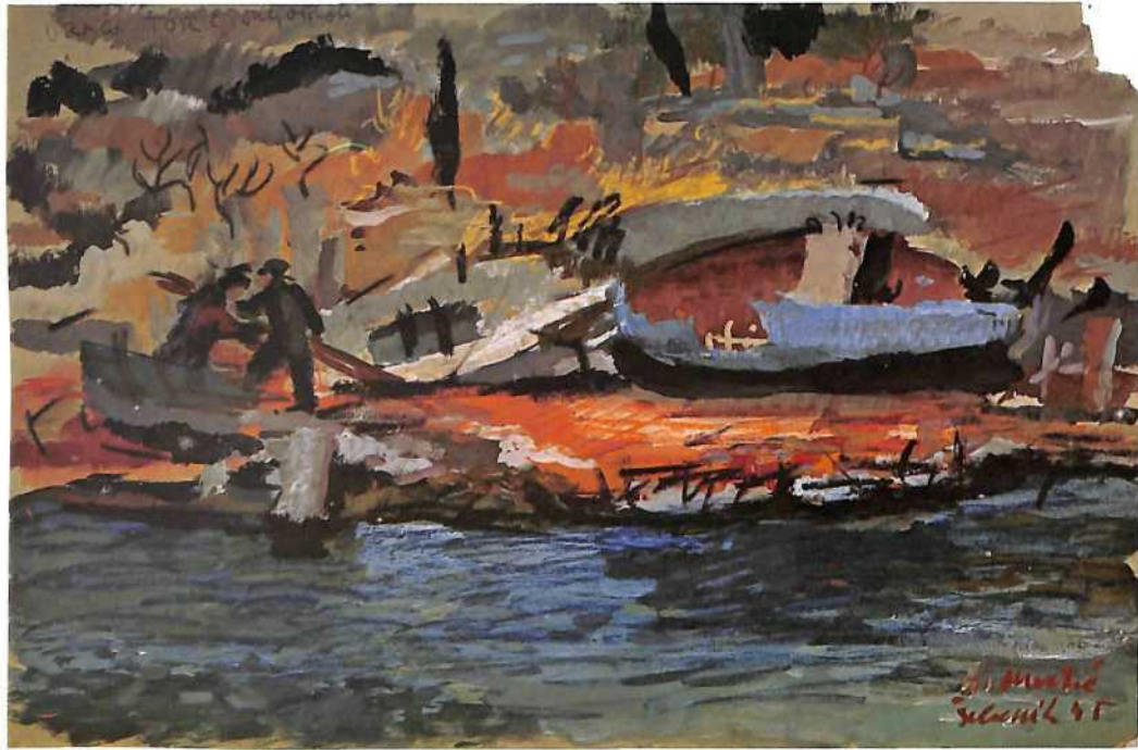
Srušeno brodogradilište »Braća Torić«, 1945.