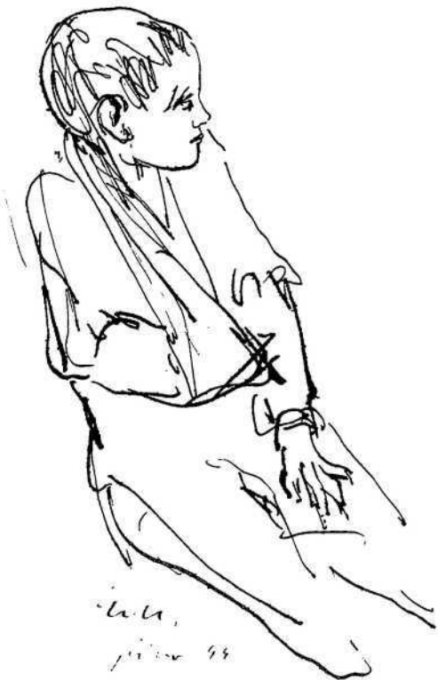
Ranjeni dječak, 1944.