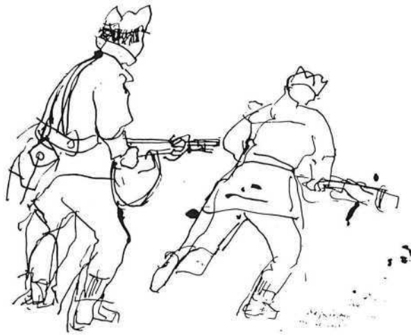
U akciji, 1944.