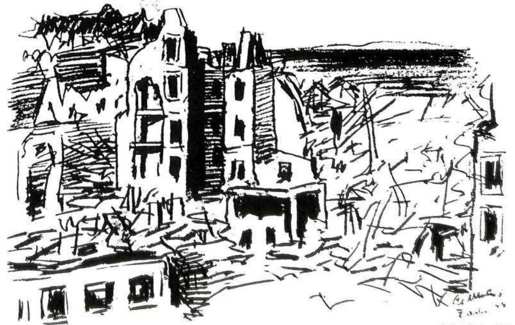
Srešeni Zadar, 1944.