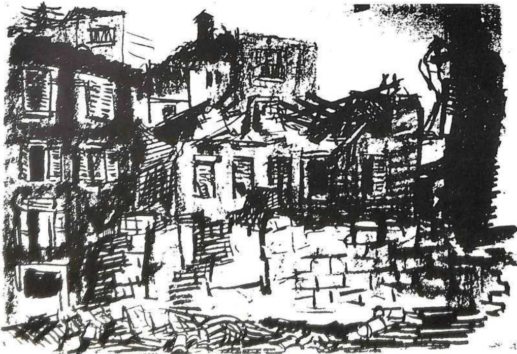
Šibenska ruševina, 1944.