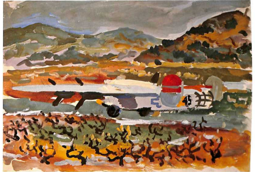
Aerodrom na Visu, 1944.