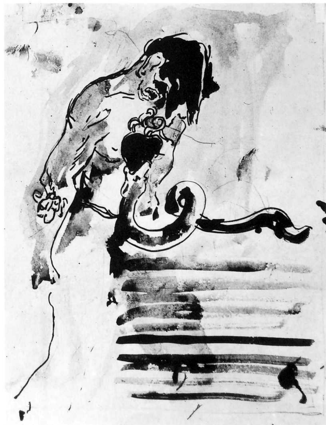
Studija za ilustraciju "Jame", 1944.