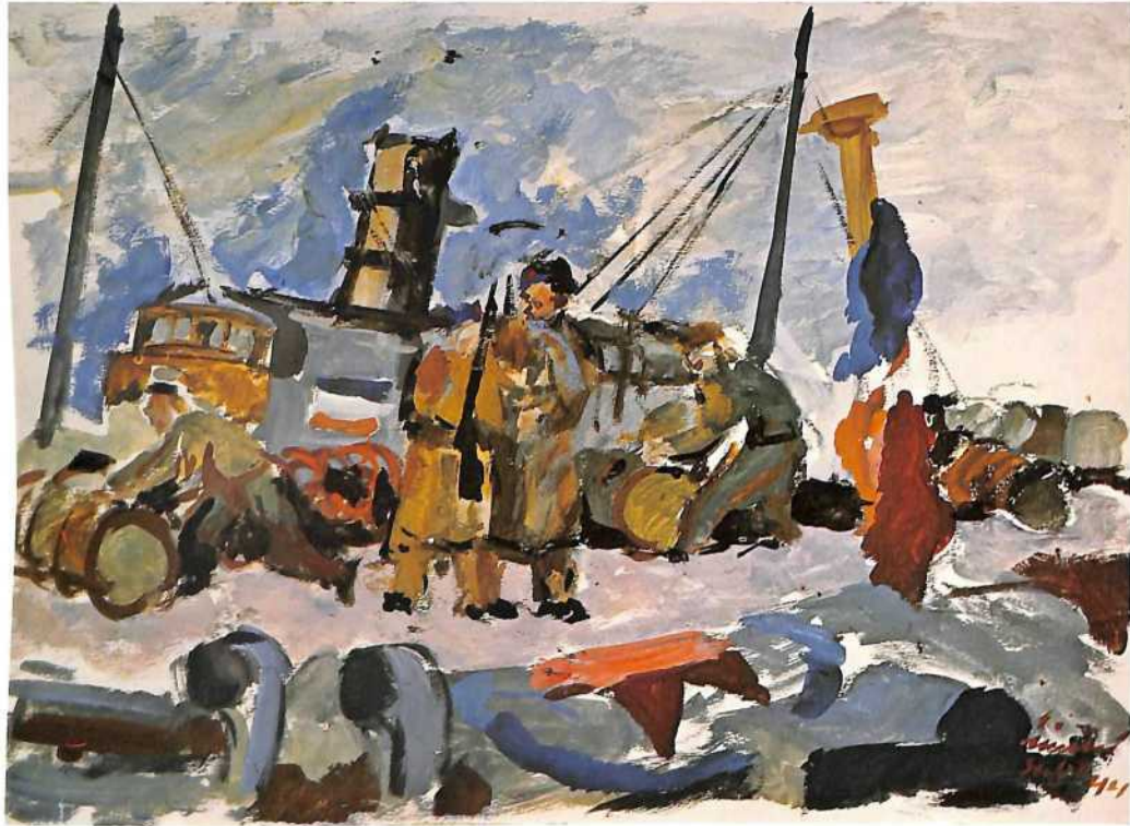
U spliskoj luci, 1944.